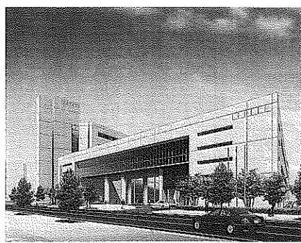
福山市立大学完成予想図

入希望を受け付ける。三年物と五年物が各五億円。 法人と二〇歳以上の個人が購入可能で、三〇〇万円を上限に一口一〇万円から応募できる。取扱金融機関は広島銀行と中国銀行、もみじ銀行。購入特典として一人(または一人法人)につきLED電球一個が贈られる。応募は3月25日(金)必着。 同市債は、同市立大学建設事業の一部に充当することを目的に発行する。同大学(同市港町)は来年4月の開学を