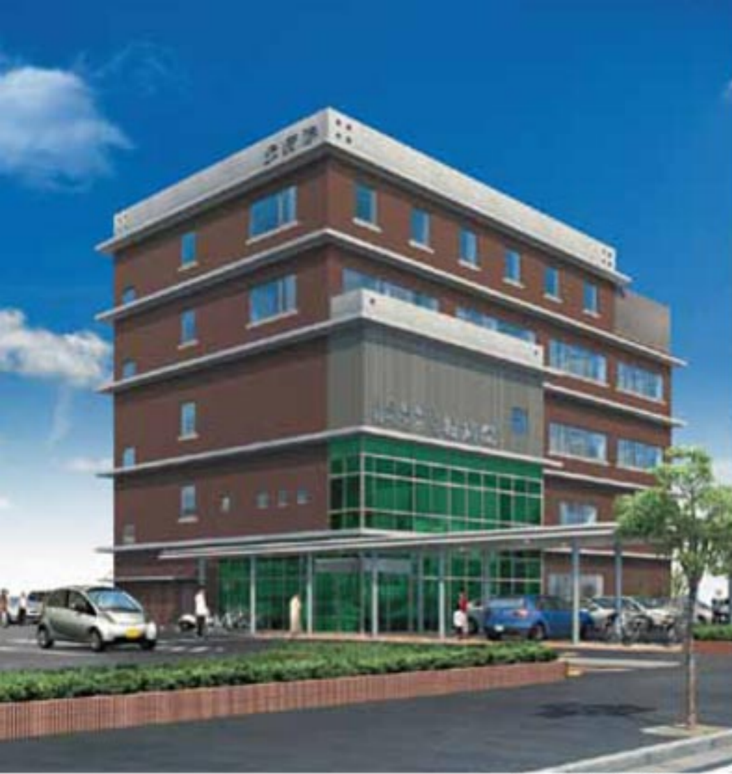
新病院 完成予想図